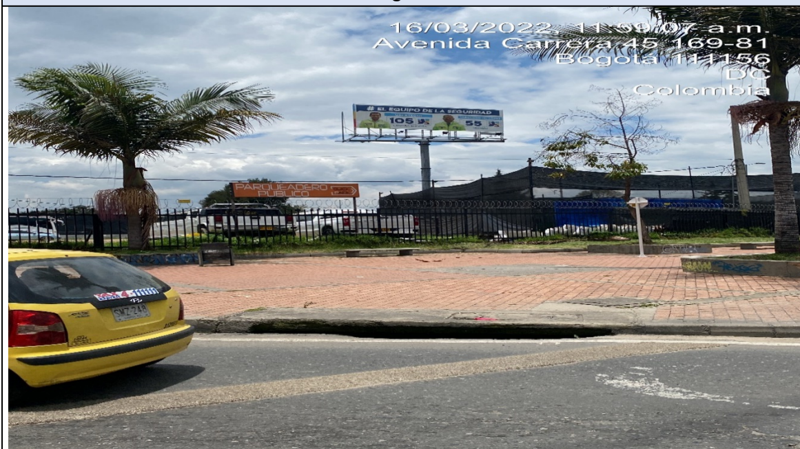
Foto Panorámica – Un (1) elemento tipo VALLA TUBULAR con publicidad política, con orientación visual NORTE - SUR sobre la KR 45, calzada OCCIDENTAL